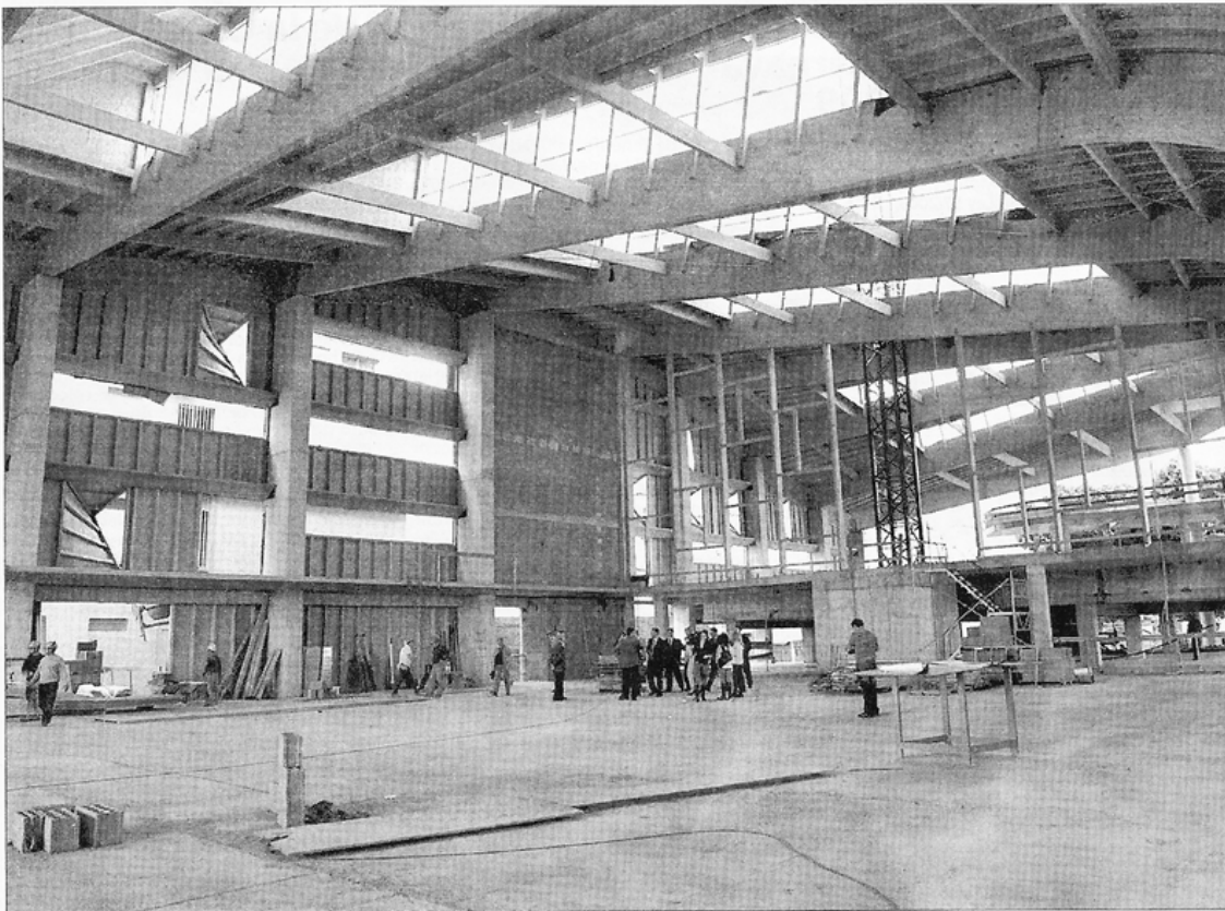
LA ZONA DONDE SE UBICARÁ el polideportivo garantizará que los alumnos cuenten con instalaciones modernas y su familia pueda mantenerse en forma.